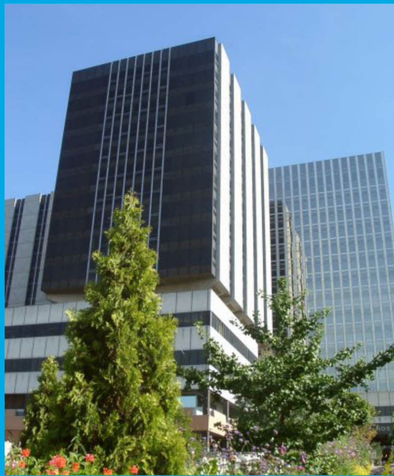
La Tour Bichat de l'extérieur