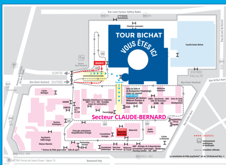
Plan disponible à l'accueil information (RdC)